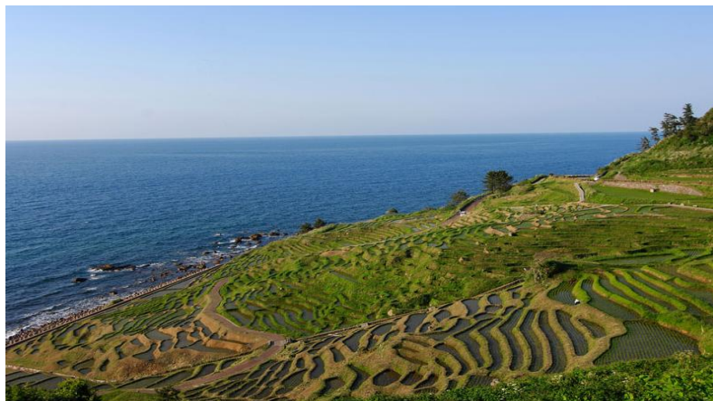
白米千枚田(ライトアップ)